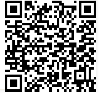
Conceptmap samenvatting tekst