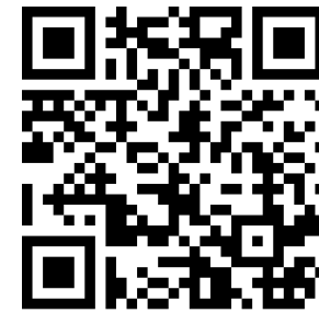
Uitleg personificaties voor brede vragen