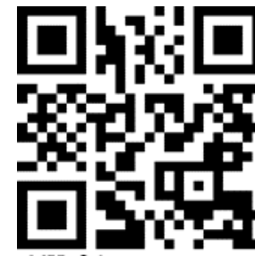
MIP 04 conceptmap voor verhaal pinguin