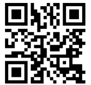
MIP 04 Conceptmap voor verhaal ijsbeer